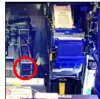
l'INTERRUPTEUR DU TERMINAL (CABINET) ET l'INTERRUPTEUR PRINCIPAL (MAIN)