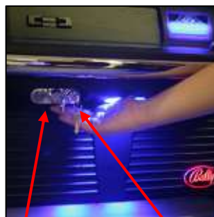
SERRURE DE LA PORTE PRINCIPALE