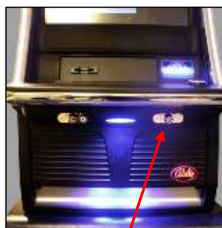
SERRURE DE LA PORTE CENTRALE