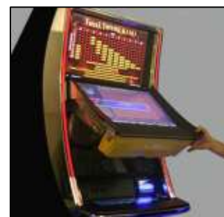
CLÉ DE VÉRIFICATION