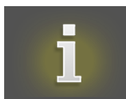
TABLEAU DES GAINS

Vue des règles du jeu et des prix à gagner pour les combinaisons de symboles gagnantes.